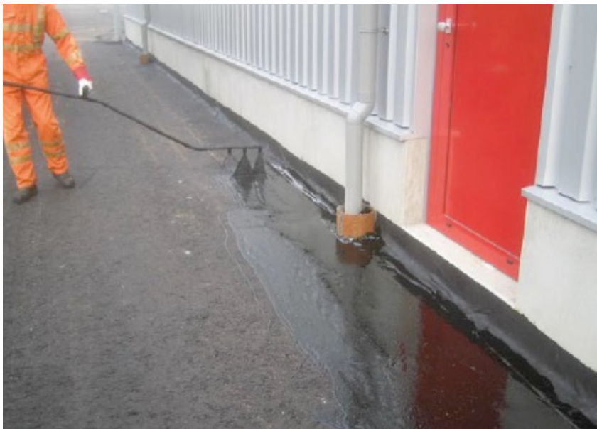
Foto: Aanbrengen bitumineus membraan.

De aannemer voorkomt dat het membraan zijn afdichtende eigenschappen verliest, door bijvoorbeeld beschadigingen door mechanische belasting of door een te hoge temperatuur van de laag die op het membraan wordt aangebracht.