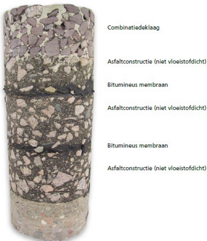
Foto: Voorbeeld van de opbouw van een combinatiedeklaag (bron: VBW Handleiding vloeistofdichte bitumineuze constructies).