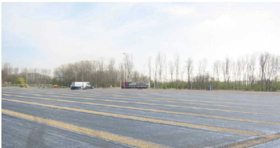
Foto: Aanleg vloeistofdichte asfaltconstructie.

Voor betonreparaties geldt NEN-EN 1504 deel 1 t/m 10 [14]. Hoofdstuk 7 van CUR/PBV-Aanbeveling 65 is niet van toepassing.