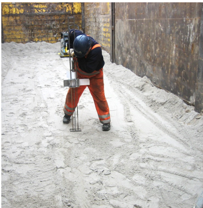
Foto: Voorbeeld van een controlemeting van de indringweerstand.